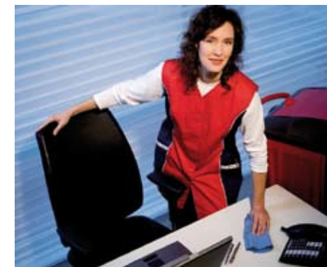
de juiste mensen op de juiste plek

Gom Ijzerlaan 11 2060 Antwerpen Tel 03/224 38 00 Fax 03/226 56 34 info@gom.be www.gom.be