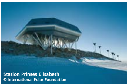
Station Prinses Elisabeth

Ook het feit dat onze planeet 'technische mankementen' begint te vertonen noopt tot een rationeel energieverbruik. Smeltende ijskappen, gaten in de ozonlaag, opeenvolgende orkanen in het Caraïbisch gebied... het zijn allemaal bewijzen of minstens aanwijzingen dat de impact van ons energieverbruik, mogelijk onherstelbare, sporen begint na te laten.