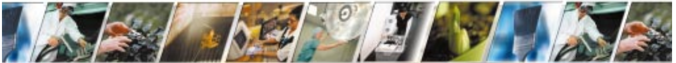
Cleaning Services • Internal Move • Food Services • Multi Services • Industrial Services • Tropical Plants • Marintec Services • Hardware Service • Cleaning Services • Internal Move • Food Services