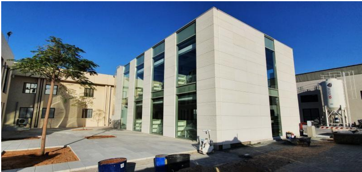
HQ Besix Dubai, partially 3D printed

Ensuite, tout est placé sous le signe de l'impression 3D. Et c'est parti pour un petit tour d'horizon sur ce sujet. Une partie du siège social de Besix est d'ailleurs imprimée en 3D... Nous nous rendons ensuite au labo 3D pour une démonstration en direct de l'impression 3D ! Besix est à la pointe mondiale de l'impression 3D dans le secteur de la construction, ce dont nous, Belges, pouvons et devons être fiers.